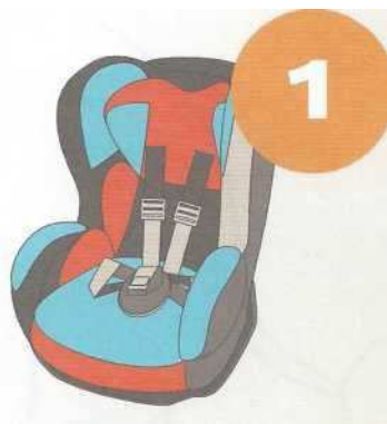
9-18 кг от 9 месяцев до 4 лет