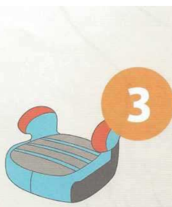
22-36 кг от 6 до 12 лет