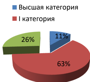
Показатели категоричности педагогов